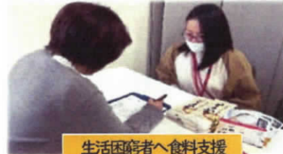
生活困窮者へ食料支援