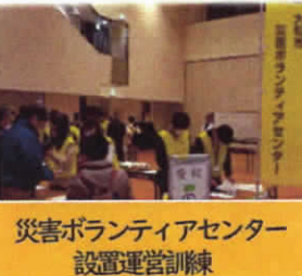
災害ボランティアセンター 設置運営訓練