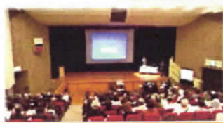
地域福祉セミナーの開催