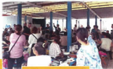
こども食堂への支援