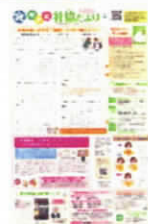
タウンニュース版 広報誌の発行