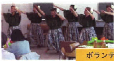
ボランティア交流会