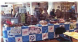
イベントでのPR活動 (健康テラスにて)