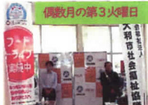
フードドライブ定期開催 (イオンモール大和にて)