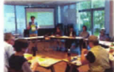
「活動計画パレット」 座談会